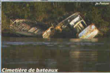
Cimetière de bateaux

Sur l'eau, à bord de votre embarcation, découvrez le patrimoine culturel et naturel de la rivière du goyen: pêche traditionnelle, exploitation des algues, ornithologie, histoires locales... en drakkar ou en kayak de mer encadré par des accompagnateurs diplômés d'état.