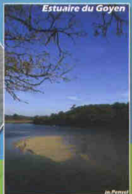
Estuaire du Goyen

POUR PLUS D'INFORMATIONS: 02.98.70.03.03